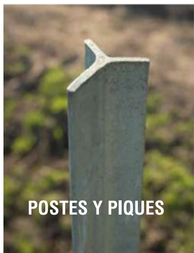
POSTES Y PIQUES